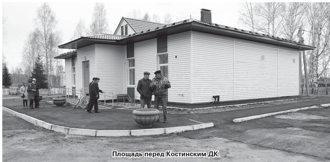
Площадь перед Костинским ДК.