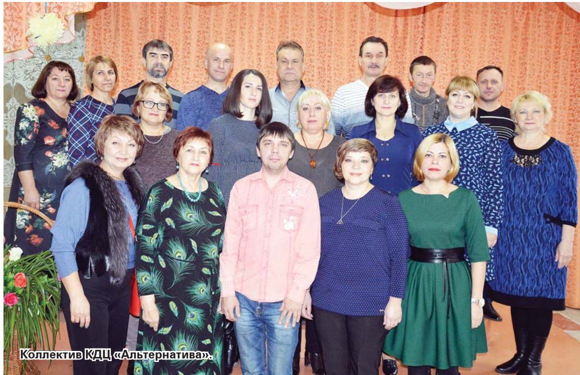
Коллектив КДЦ «Альтернатива».

«Дарить людям радость!» – с этого простого и понятного каждому девиза начал в 1988 году свою деятельность Храм талантов муромцевской культуры и продолжает сегодня. Это организация и проведение массовых праздничных народных гуляний, юбилейных и профессиональных праздников, торжеств, концертных про-