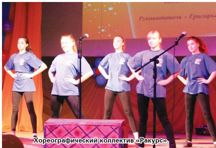
Хореографический коллектив «Ракурс».