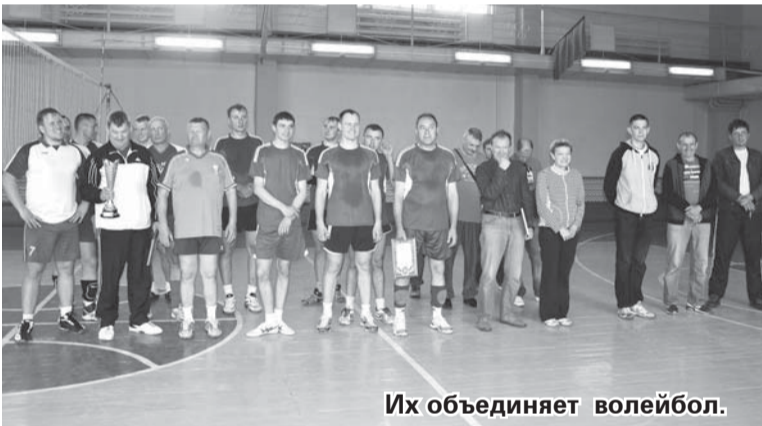
Их объединяет волейбол.