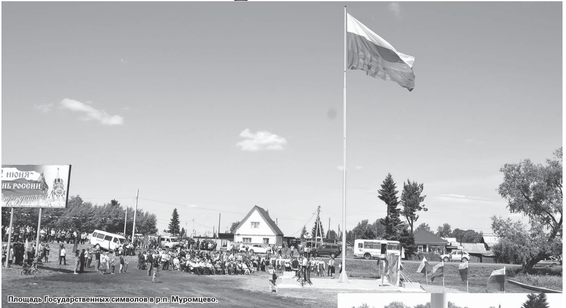
Площадь Государственных символов в р.п. Муромцево.