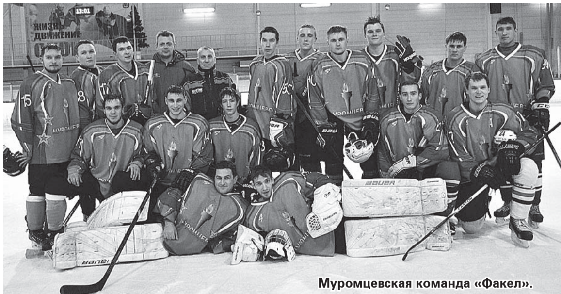
Муромцевская команда «Факел».

Уже второй год подряд наша команда «Факел» играет в чемпионате ЛХЛ (Любительская хоккейная лига) города Омска. Мой собеседник уверен, что участие в этом чемпионате - прекрасная возможность для игроков быть в хорошей форме. Следует отметить, что ни один район в этой лиге больше