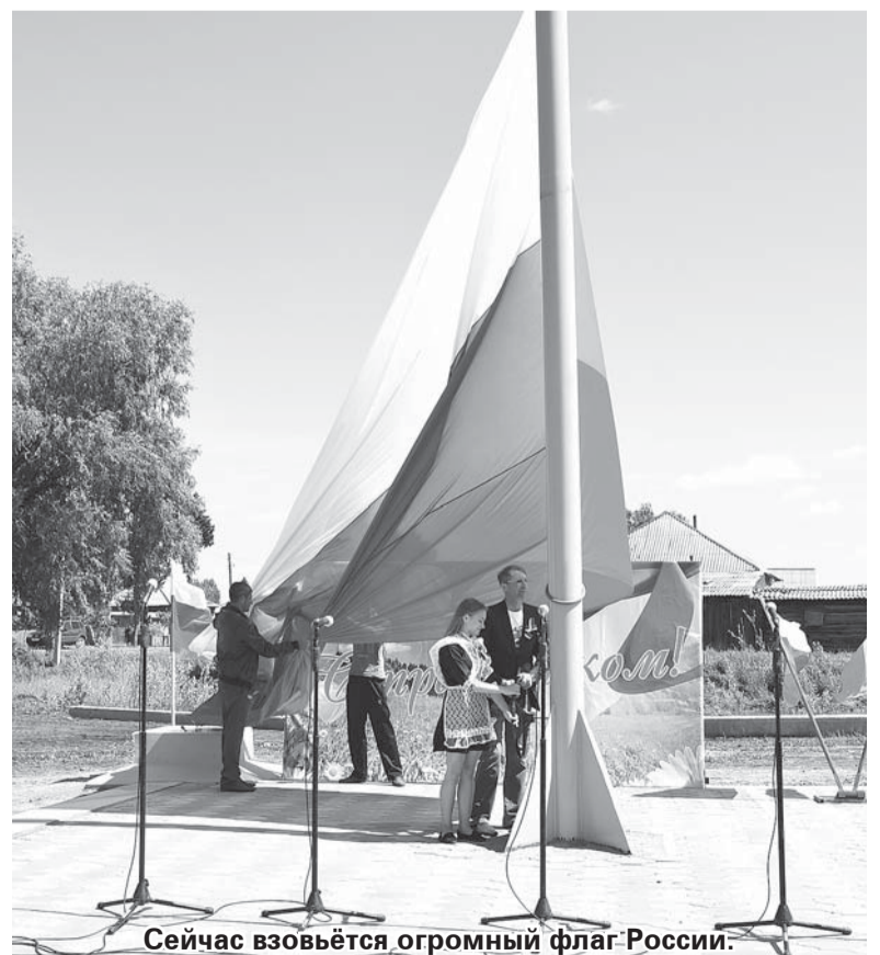
Сейчас взвьётся огромный флаг России.