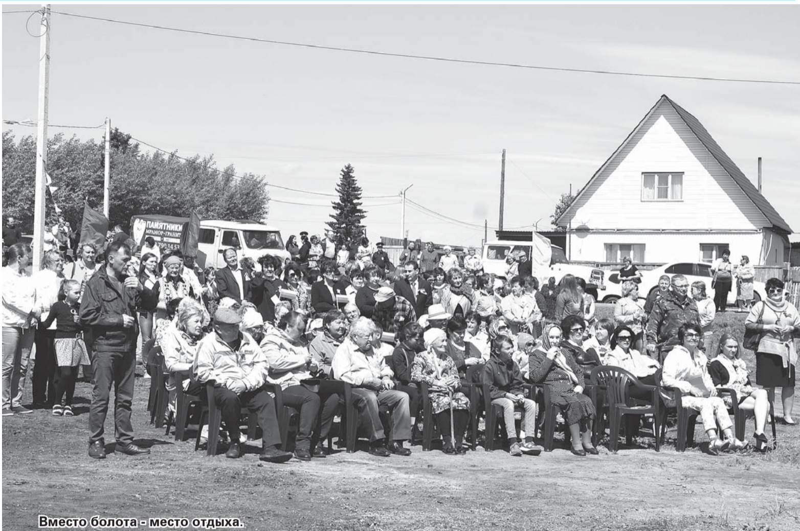
Вместо болота - место отдыха.