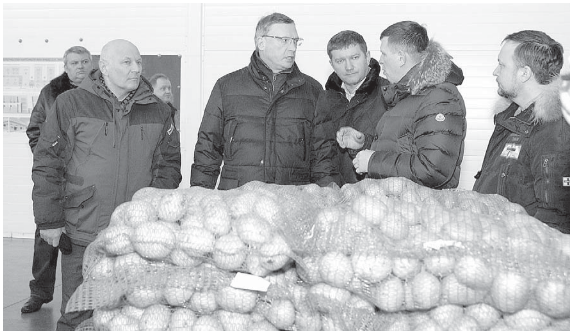
Правительство региона поддержит предприятия, занимающиеся сортировкой, фасовкой и переработкой картофеля.