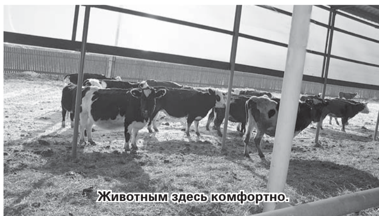
Животным здесь комфортно.