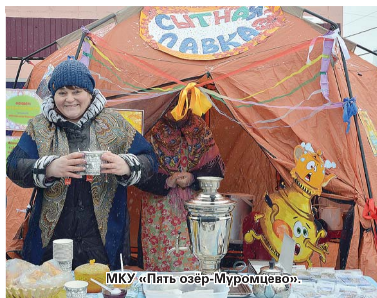
МКУ «Пять озёр-Муромцево».