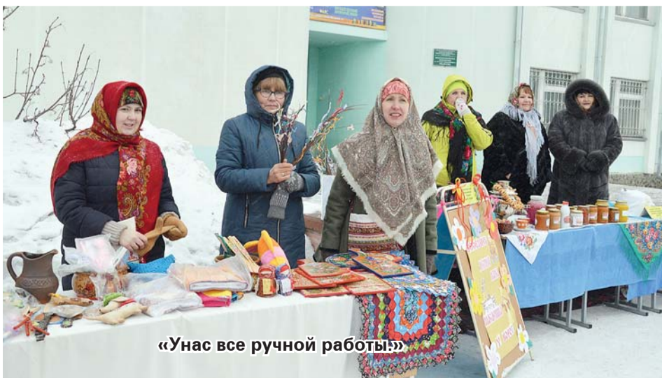
«У нас все ручной работы!»