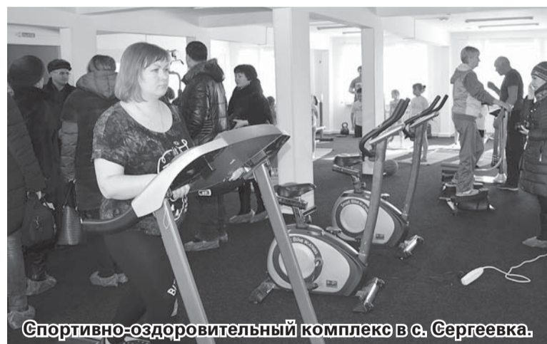
Спортивно-оздоровительный комплекс в с. Сергеевка.

Порту. Провес. Вигонь. Аджани. Дагер. Вигонь. Нерв. Паста. Ослы. Гаев. Сварка. Гавр. Роу. Роба. Сельга. Тонна. Волк. Авран. Шакал. Нить. Арто. Иврит. Мясо. Бекон. Враг. Ушан. Котка. Брак. Востум. Торг. Срок. Рвань. Гитана. Лаплас. Лир. Елань. Ипат. Кагал. Снег. Росса. Рурк. Тонио. Опал. Изоп. Игра. Сагиб. Януш. Орли. Прототип. Нокдаун. Пазл. Ибль. Неуч. Очи. Три. Аноа. Шило. Коллапс.