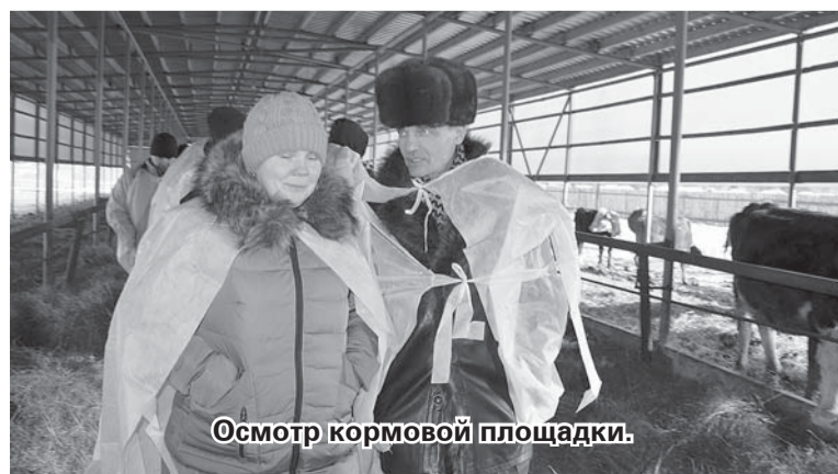
Осмотр кормовой площадки.