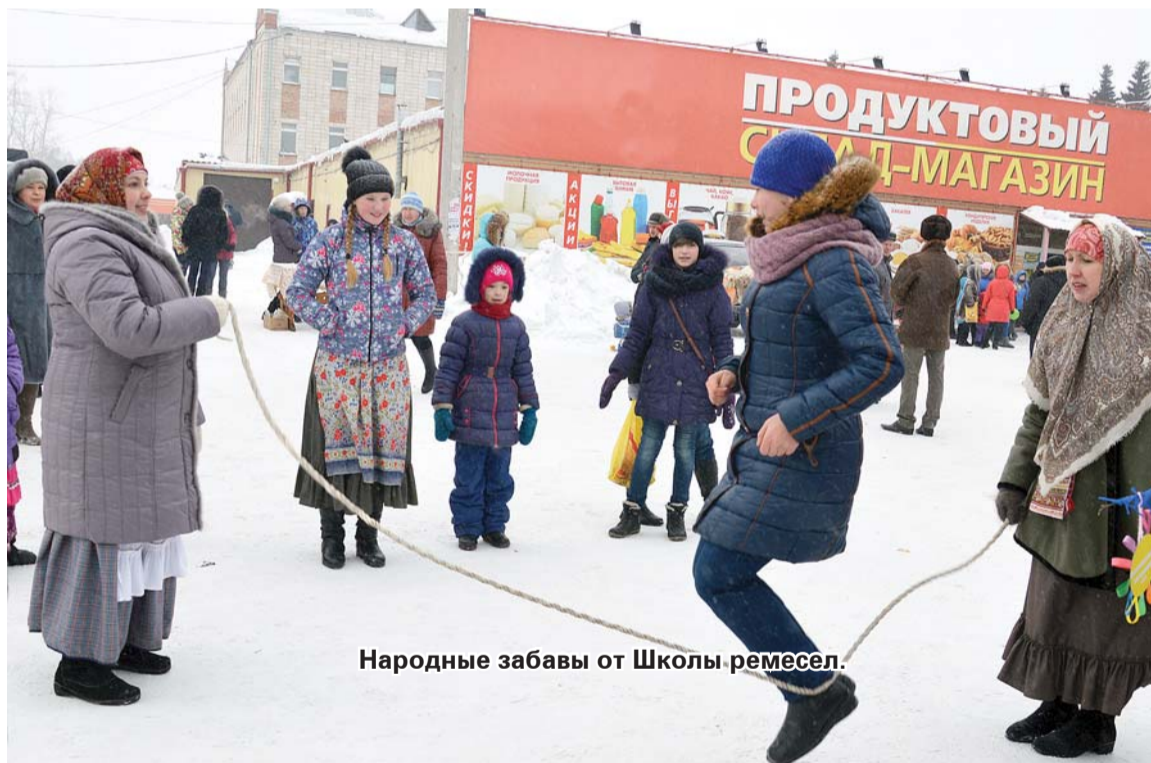
Народные забавы от Школы ремесел.