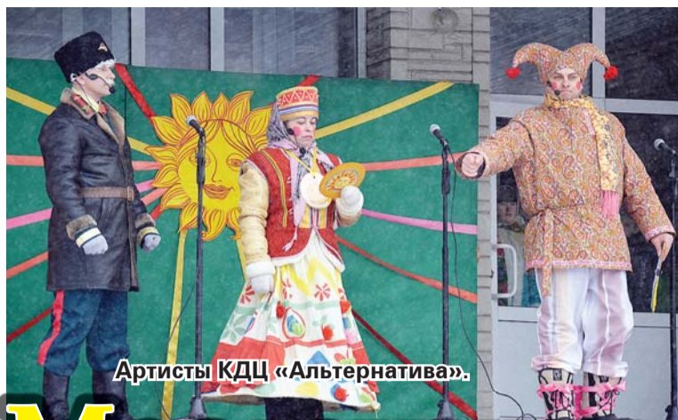
Артисты КДЦ «Альтернатива».