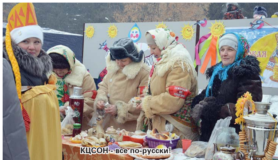
КЦСОН - все по-русски!