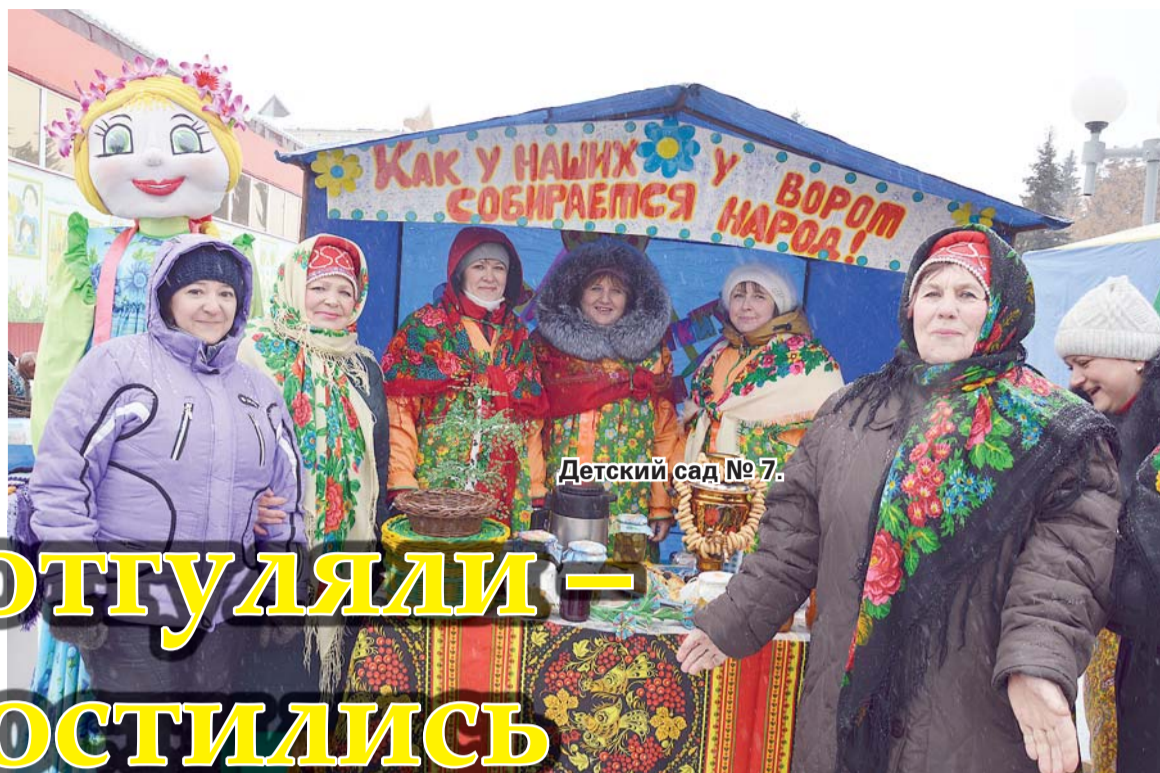
Детский сад № 7.