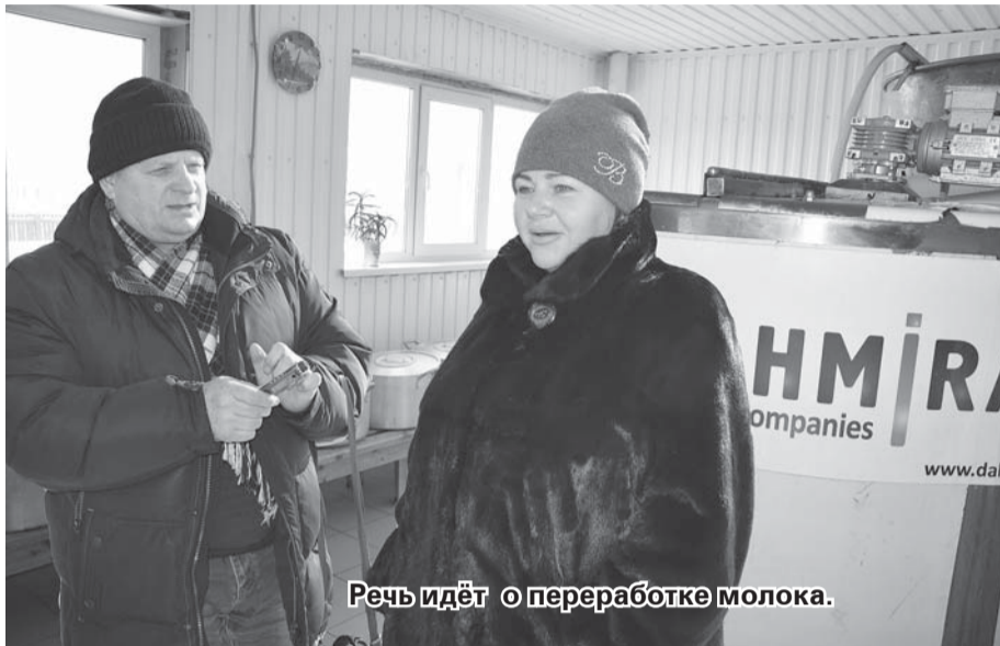
Речь идёт о переработке молока.

Сегодня мы рассказали о нескольких точках роста в Оконешниковском районе. Хотя их, конечно же, гораздо больше. Но главное, что мы уяснили для себя, будучи гостями на этой гостеприимной земле, так это то, что район развивается, здесь появляются новые производства и дополнительные ра-