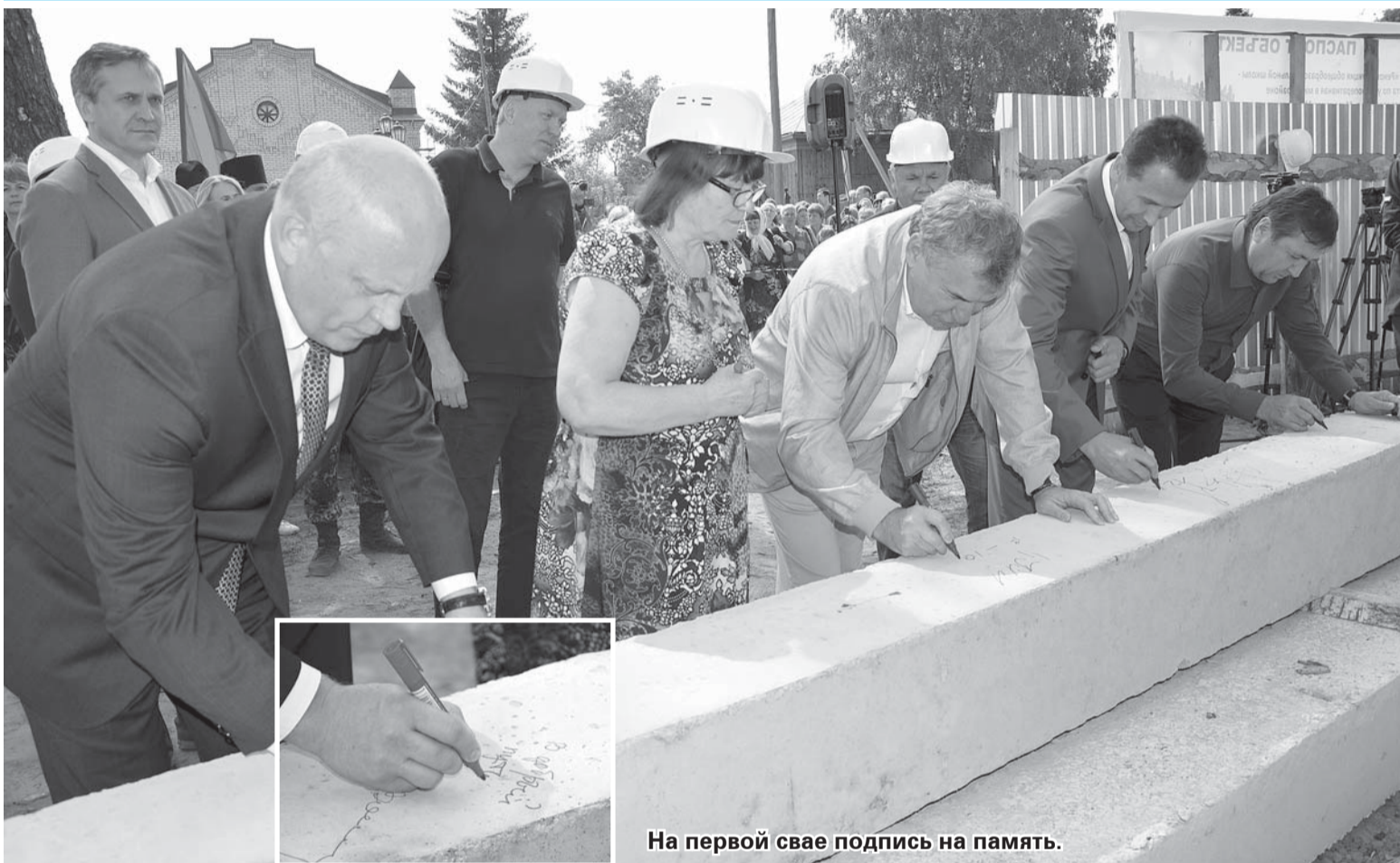
На первой свае подпись на память.