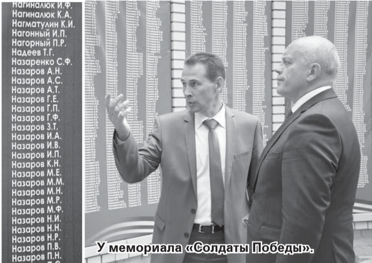
У мемориала «Солдаты Победы».