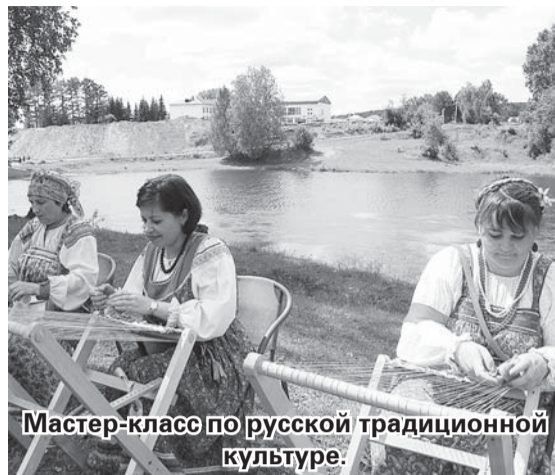
Мастер-класс по русской традиционной культуре.

12 июля на территории Петропавловского винокуренного завода (памятника истории и культуры XIX в.) Муромцевского района стартовал V фестиваль «Муромцевская Ривьера».