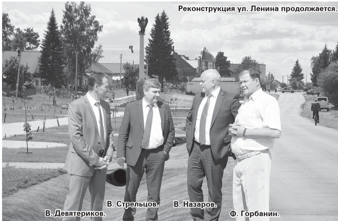
Реконструкция ул. Ленина продолжается.