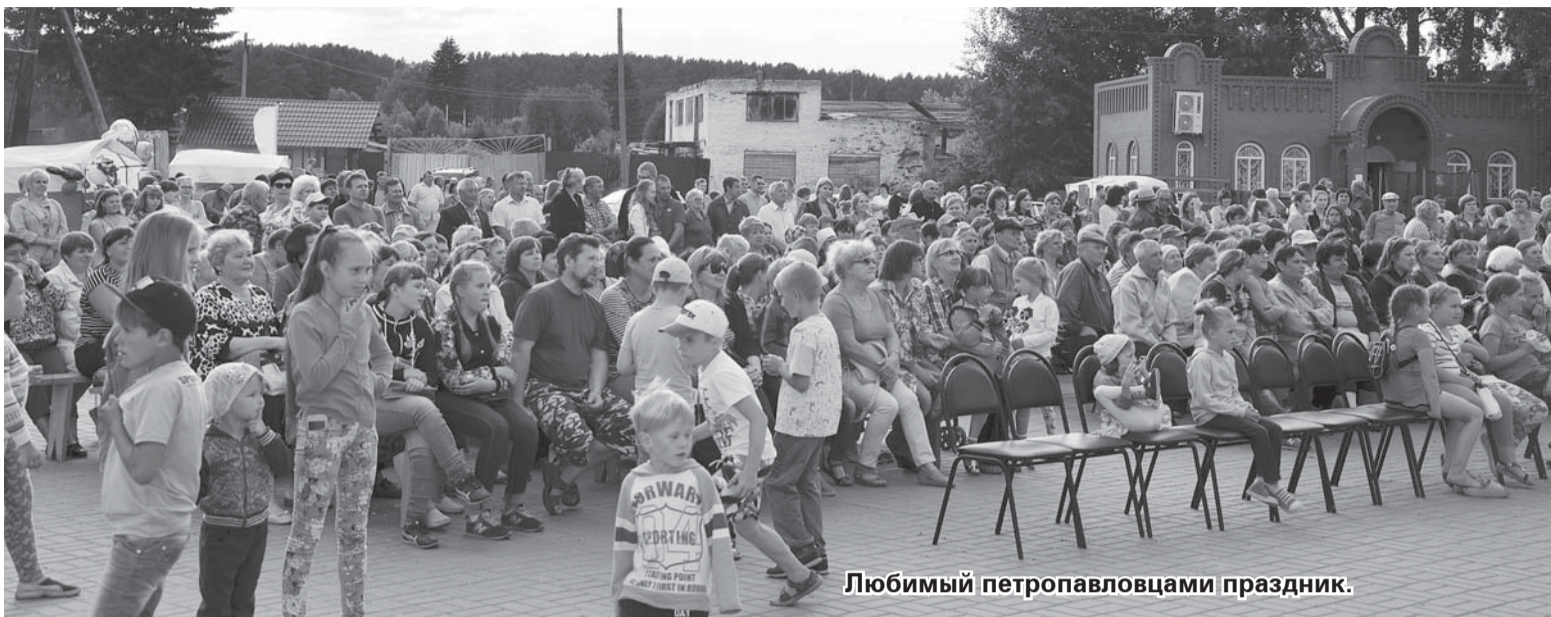
Любимый петропавловцами праздник.