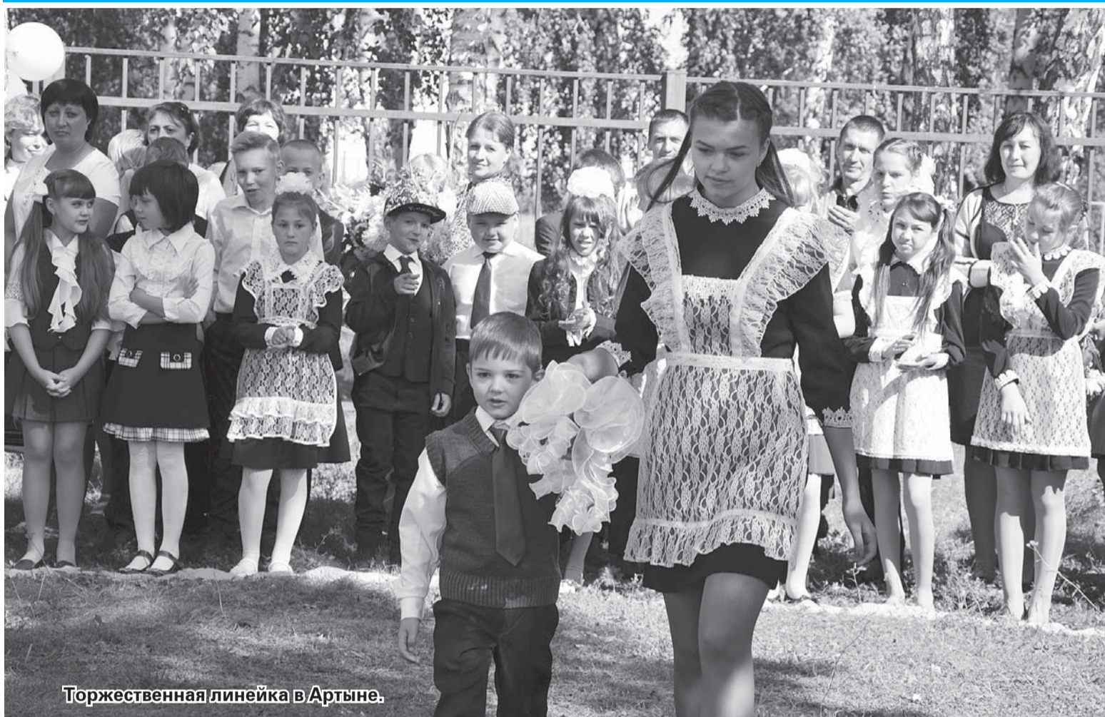
Торжественная линейка в Артыне.