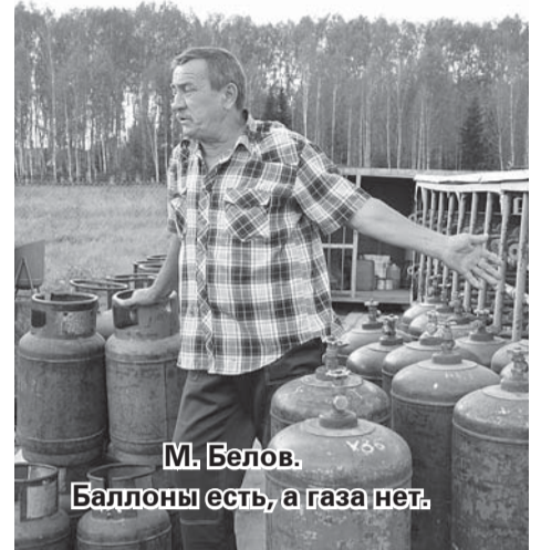
М. Белов. Баллоны есть, а газа нет.