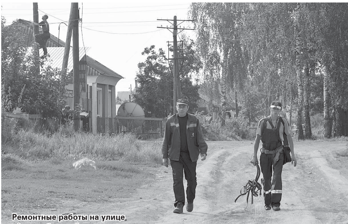
Ремонтные работы на улице Автомобильной в разгаре.

В настоящее время муромцевские связисты ведут ремонтные работы на старых коммуникационных линиях. Совсем недавно отремонтировали телефонные сети по улице Строительной. На данный момент частично отработали улицу 30 лет Победы (до магазина «Орион») и работают на улицах Молодёжная и Автомобильная. В планах отремонтировать коммуникации на улице Королёва и продолжить работы на ул. 30 лет Победы. Следует добавить, что обновлённые сети несут качественный Интернет и телевидение.