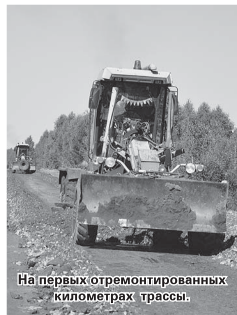
На первых отремонтированных километрах трассы.

погодные условия. Дорожники производят здесь восстановление профиля земляного полотна и устройство покрытия из грунто-щебня. Задействована вся имеющаяся техника ДРСУ, плюс наемные работники (на экскаваторе, КраЗе, КамАЗе).