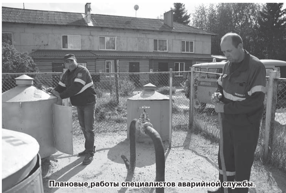
Плановые работы специалистов аварийной службы.

газом в нашем районе никто не заявлялся. Также он уточнил, что Муромцевский газовый участок не только не несёт ответственности за качество и количество топлива в баллонах, реализуемых конкурентами, но и не имеет право заправлять такие баллоны. Тому, кто приобрёл товар на стороне, стоит задуматься, где он будет потом искать продавца, чтобы обменять баллон. Немаловажно и то, что некачественный газ негативно влияет на техническое состояние плит, уменьшая их срок эксплуатации.