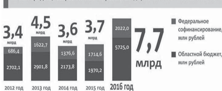
Объем средств, направленных на развитие дорожной сети Омской области

и Сибирский международный марафон, в котором участвуют тысячи профессионалов и любителей спорта.