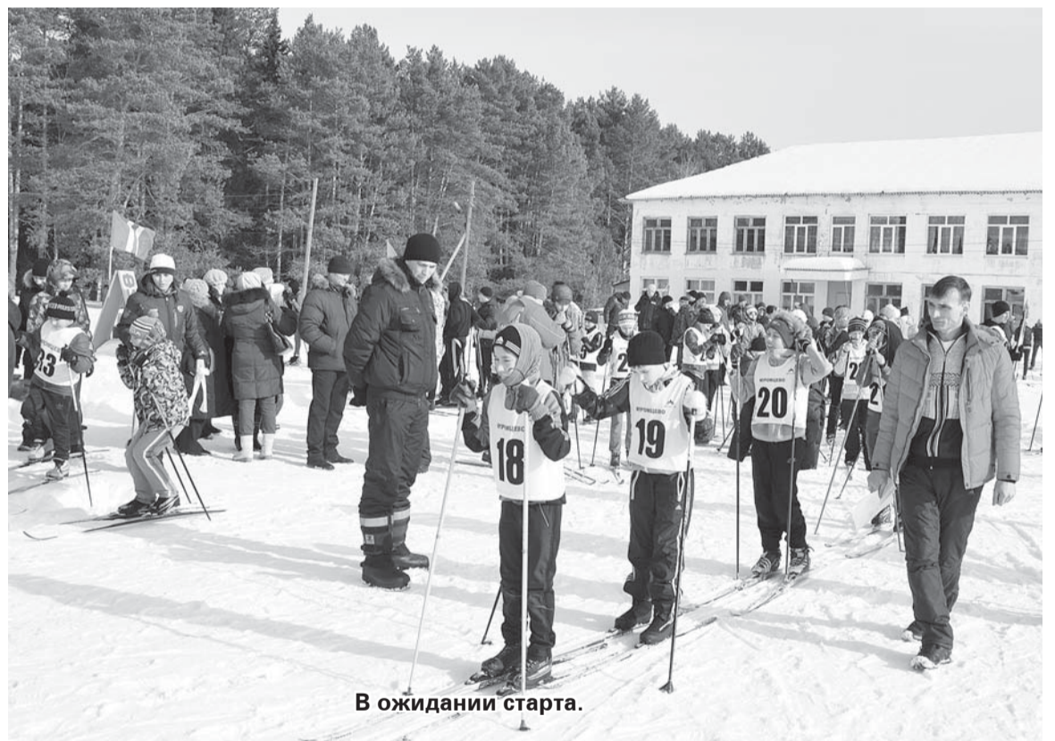
В ожидании старта.

Своим мнением об организации и проведении соревнований с корреспондентом