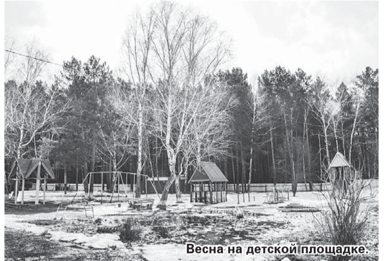
Весна на детской площадке.