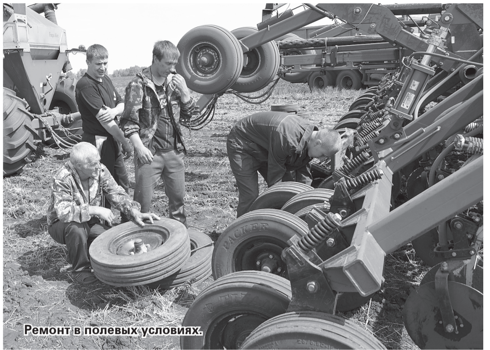
Ремонт в полевых условиях.