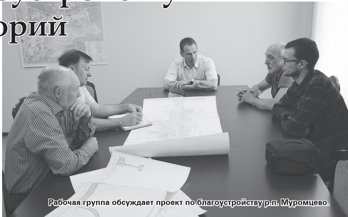
Рабочая группа обсуждает проект по благоустройству р.п. Муромцево.

На сегодняшний день сформированные группы студентов уже посетили часть районов, в частности Муромцевский и Седельниковский. На месте они посмотрели генеральные планы территории, сделали фотографии на местности для дальнейшей разработки эскизных проектов. Теперь начнет-