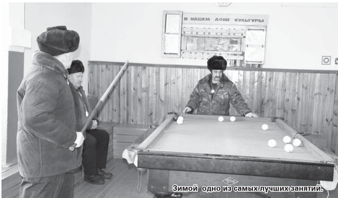
Зимой одно из самых лучших занятий.

Большой капитальный ремонт по замене крыши в ДК был в прошлом году. Последствия протекания, правда, приходится устранять до сих пор. Помещение огромное, поэтому косметический ремонт проводится поэтапно по мере изыскания средств. А вот что касается порядка и чистоты, то в этом