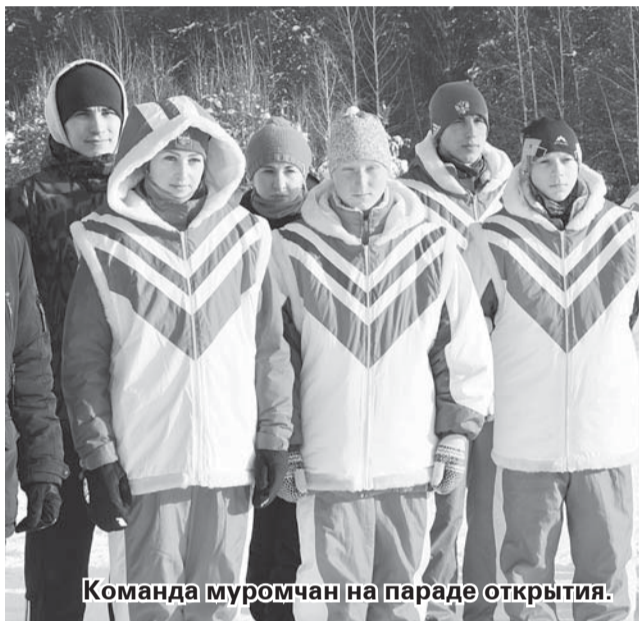
Команда муромчан на параде открытия.

В командном первенстве места распределены следующим образом: первое место - команда Тарского района. На втором месте (набрав в общем зачёте на семь очков меньше) - муромчане. Третьими на пьедестале почета поднялись ребята из Азовского района,