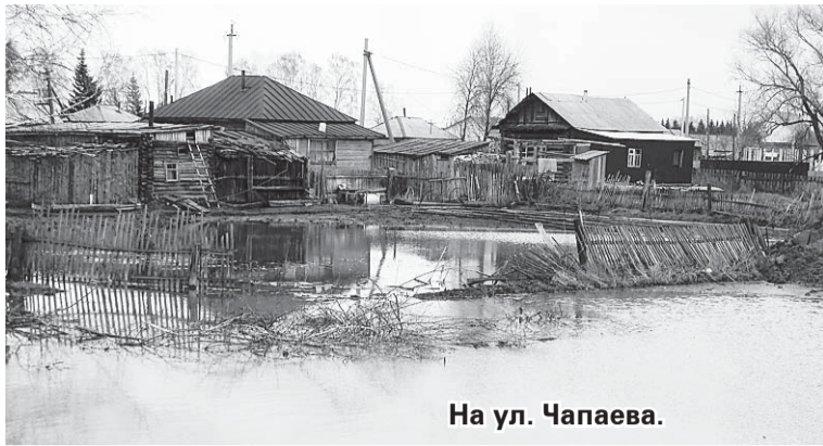
На ул. Чапаева.

возможности вырастить на своём огороде хоть что-то.