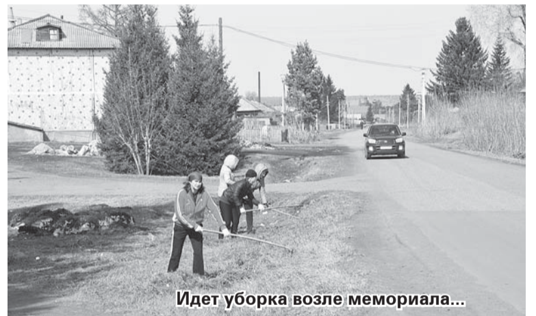
Идет уборка возле мемориала...

Ольга МАРТЫНЕЦ.