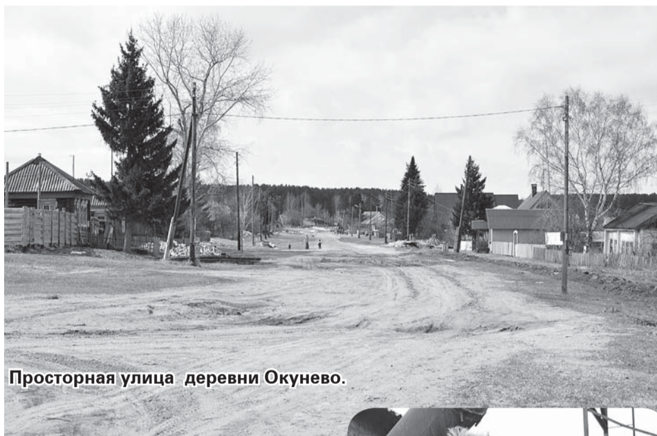
Просторная улица деревни Окунево.

Продолжая тему уличного освещения, отметим, что в деревне Лисино ос-