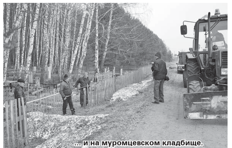
... и на муромцевском кладбище.