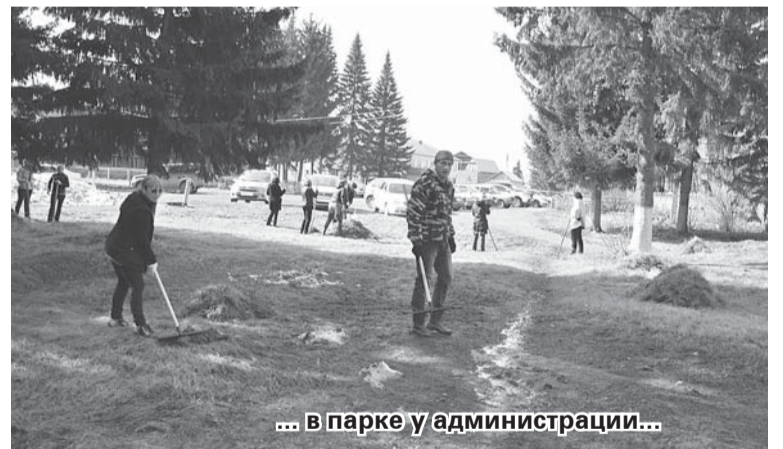
... в парке у администрации...