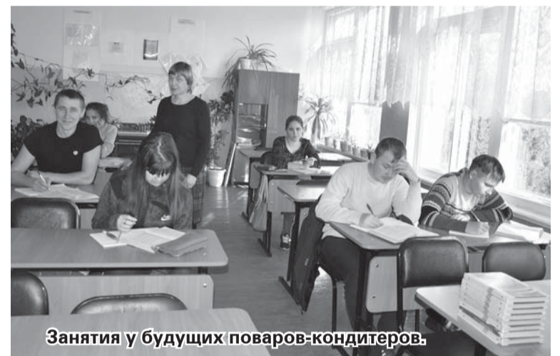
Занятия у будущих поваров-кондитеров.