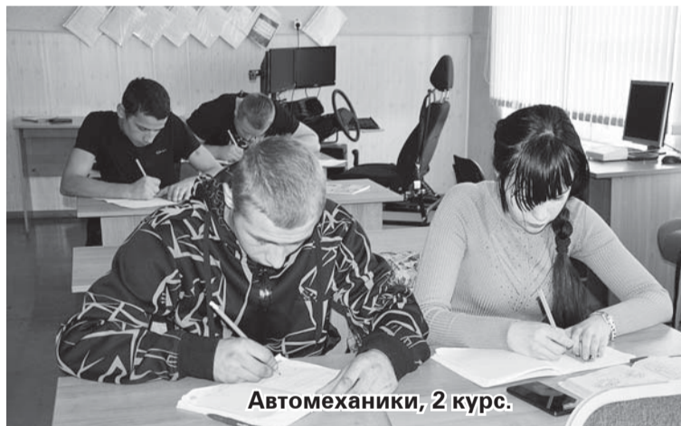
Автомеханики, 2 курс.