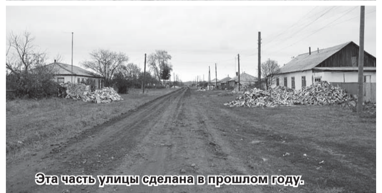
Эта часть улицы сделана в прошлом году.