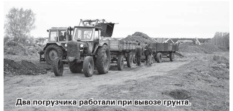
Два погрузчика работали при вывозе грунта.