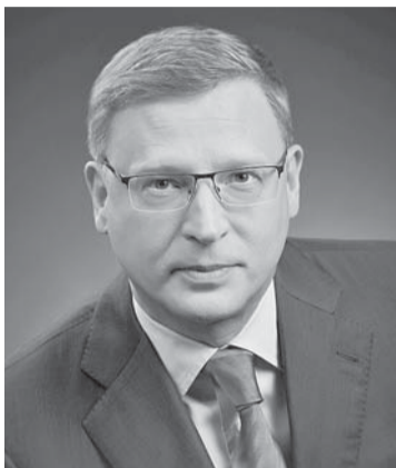
Александр БУРКОВ Губернатор Омской области:

Александр Бурков в ходе разговора акцентировал внимание на преференциях для регионов, находящихся в зоне рискованного земледелия, к которой, как известно, относится и Омская область. В частности, необходимо субсидировать железнодорожные перевозки экспортной продукции. Установление льготных тарифов на перевозки зерна наземным транспортом особо актуально для регионов Сибири. Отсутствие таких условий окажет негативное влияние на финансовое состояние сельскохозяйственных товаропроизводителей в удаленных от портов регионах. Александр Бурков обратился с просьбой продлить данную меру поддержки с начала 2019 года, чтобы омские аграрии смогли реализовать зерно по лучшей цене.