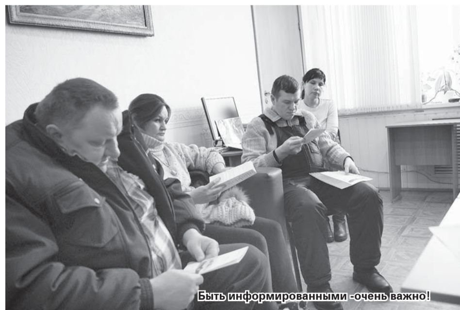
Быть информированными - очень важно!

участники программы реабилитации людей, имеющих, скажем так, иные возможности по состоянию здоровья. И наша задача, чтобы они быстрее адаптировались в обществе». В частности, Центр занятости готов предложить желающим продолжить трудовую деятельность пройти обучение и в дальнейшем, пусть даже временное, но все же трудоустройство. Это могут быть лица, зарегистрированные в