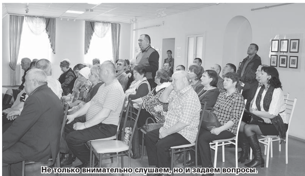
Не только внимательно слушаем, но и задаем вопросы.