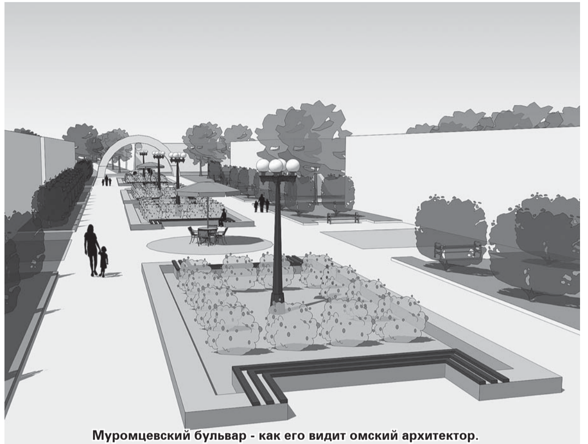
Муромцевский бульвар - как его видит омский архитектор.