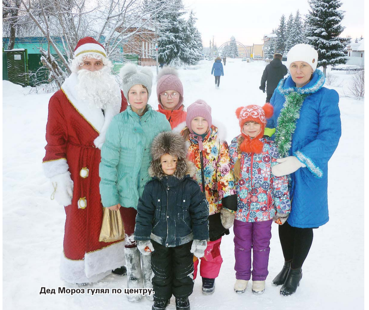
Дед Мороз гулял по центру.

По сложившейся традиции в преддверии новогодних праздников сотрудниками полиции проводится благотворительная акция «Полицейский Дед Мороз». Цель акции состоит не только в том, чтобы поздравить детишек и подарить подарки, но также проведение воспитательной работы с детьми, правовое просвещение молодежи, формирование положительного имиджа сотрудников полиции.