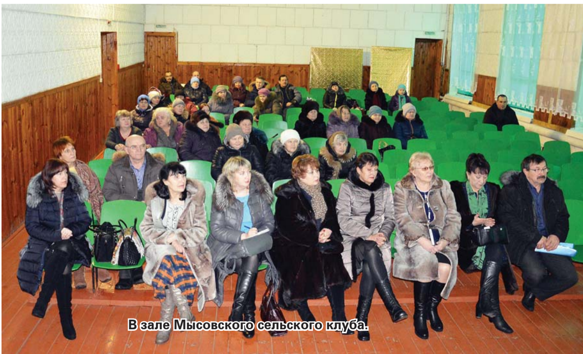
В зале Мысовского сельского клуба.