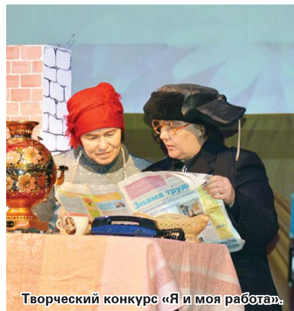
Творческий конкурс «Я и моя работа».