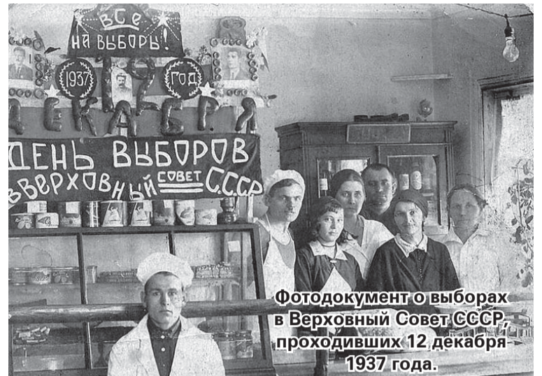
Фотодокумент о выборах в Верховный Совет СССР, проходивших 12 декабря 1937 года.