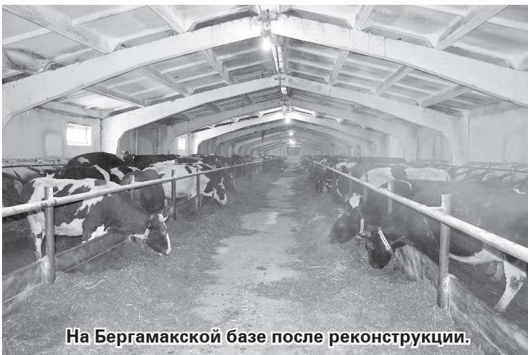
На Бергамаской базе после реконструкции.