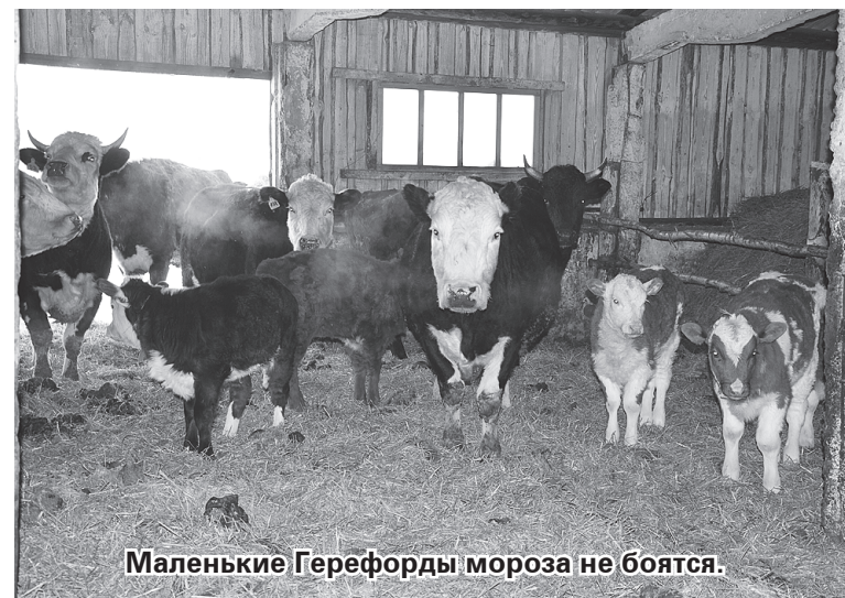
Маленькие Герефорды мороза не боятся.